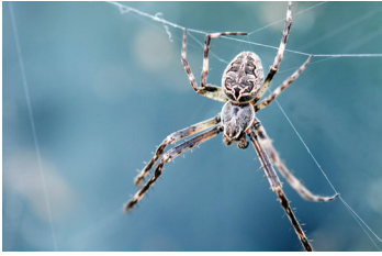
العناكب الأخرى (باستثناء العنكبوت القمعي والعناكب السوداء الكبيرة)