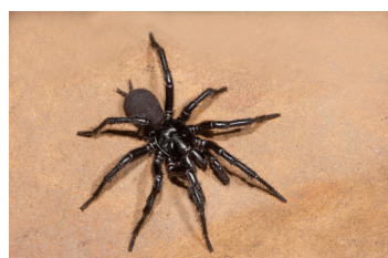
Αράχνες του Σίδνεϊ και μεγάλες μαύρες αράχνες