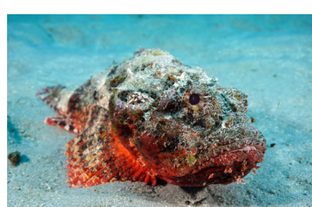
Ψάρια που τσιμπούν (συμπεριλαμβανομένων των πετρόψαρων)