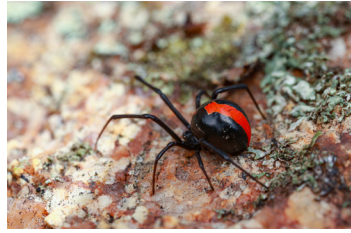
عناكب حمراء الظهر