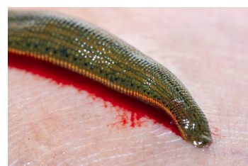
Sanguisughe (rimuovi prima la sanguisuga e lava l'area interessata)