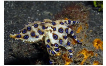
أخطبوط بحلقة زرقاء

اعرف المزيد عن المخلوقات السامة والإسعافات الأولية عبر تطبيق Australian Bites & Stings! للمزيد من المعلومات حول اللدغات أو اللسعات، يُرجى التحدث إلى طبيبك.