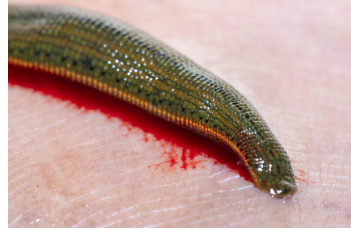
العلقيات (أزل العلقة واغسل المنطقة أولاً)

*يمكن أن يصاب الأشخاص بردود فعل تحسسية شديدة تجاه لدغات/لسعات الحشرات. اتصل بالرقم 000 للحصول على المساعدة الطارئة في حالة حدوث ذلك.