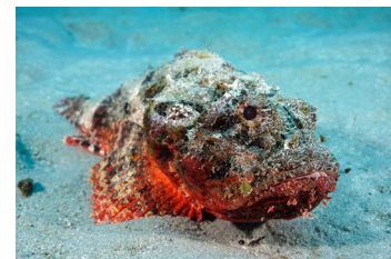
السّمك اللّسّاع (بما في ذلك السمك الصخري)