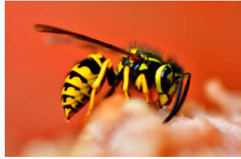
دبابير، نحل، نمل (أزل اللسع بعناية عن طريق الكشط أولاً)