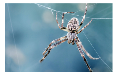
Άλλες αράχνες (εκτός από την αράχνη του Σίδνεϊ και μεγάλες μαύρες αράχνες)