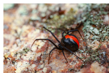
Ragni dal dorso rosso