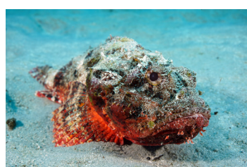
Pesce pungente (incluso il Pesce pietra)