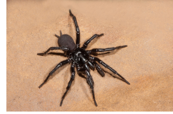
العناكب القمعية والعناكب السوداء الكبيرة