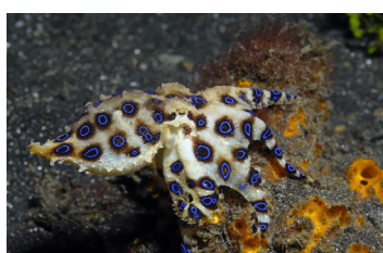
Polpi dagli anelli blu