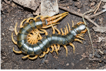
الحريشة (أم أربعة وأربعين)