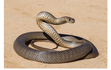
الثعابين الأسترالية بما في ذلك الثعابين البحرية