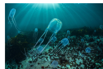
Cubomeduse e Irucangi